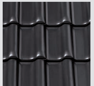
NUANCE anthrazit engobiert