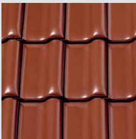
NUANCE kupferrot engobiert